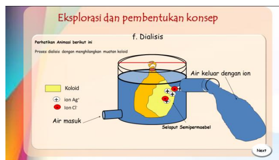
Gambar 2. Contoh Level Representasi Kimia

tampilan tiga level representasi kimia materi sistem koloid dalam media pembelajaran PowerPoint interaktif.